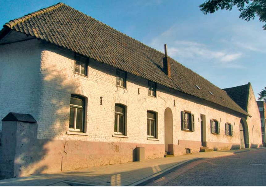
Ein typischer Vierkanthof

Wir starten am Bahnhof in Heerlen an der Stationsstraat . Wir wenden uns nach rechts und fahren bis an eine Ampel . Hier entdecken wir den ersten Wegweiser der Parkstad-Route und biegen rechts ab in den Parallelweg . Wir überqueren eine Brücke und fahren links ab in den Eikenderweg , der uns durch eine Siedlung bis zu einer Schule führt, und biegen zwischen Schule und Parkplatz nach links ab in die Pijperstraat . Leicht bergab rollen wir nun durch eine Unterführung und folgen der Straße durch den Landschaftspark Terworm hinab ins Tal. Dort überqueren wir einen Bach und halten uns an zwei Gabelungen jeweils links. An einer T-Kreuzung halten wir uns links in Richtung Knotenpunkt (=KP) 51 und durchfahren mit den Wegweisern in Richtung KP 51 eine Wohnsiedlung . An der Kreuzung Weltertuystraat/De Doom verlassen wir die Wegweiser in Richtung KP 51, bleiben auf der Weltertuystraat und biegen vor einer Kirche rechts ab in die Welterkerkstraat . Wir gelangen in den Park Weltervijver mit seinem idyllischen Mühlenteich und der Weltermolen .